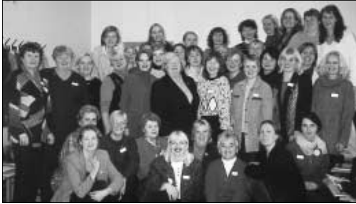
Estonia training participants came away with new insights into CAP issues.

"You have made me understand that I am responsible for children's safety!"